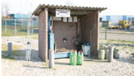
Gasvulstations voor o.a. LPG-gasflessen

Het vullen van gasflessen vindt manueel plaats. Bij LPG, Propaan en Butaan wordt bijvoorbeeld op basis van gewicht beoordeeld of het afvullen kan stoppen. Het vullen geschiedt door middel van een vulslang.