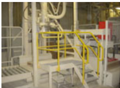
Vulmachine big bags

Afvlumachines voor vaste stoffen vullen vaak af in zakken variërend van 5 kg tot 25 kg. Bij grotere hoeveelheden worden vaak big bags toegepast. Het stoppen van het afvullen wordt bepaald door het gewicht of door vooraf ingestelde vulhoeveelheden.