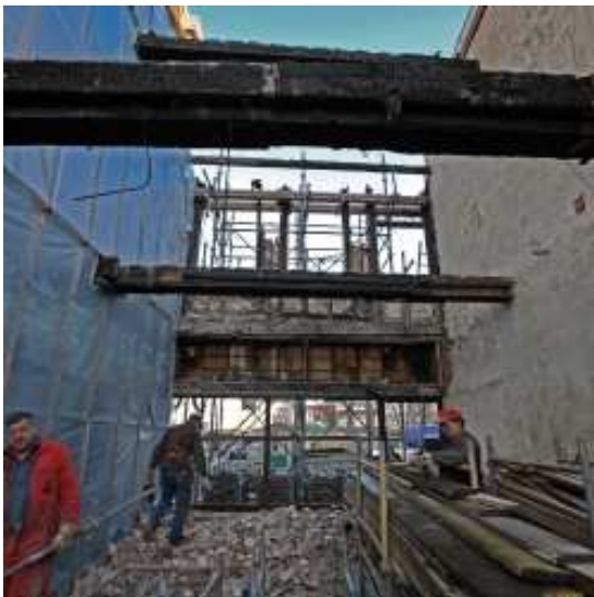
De brand nader beschouwd