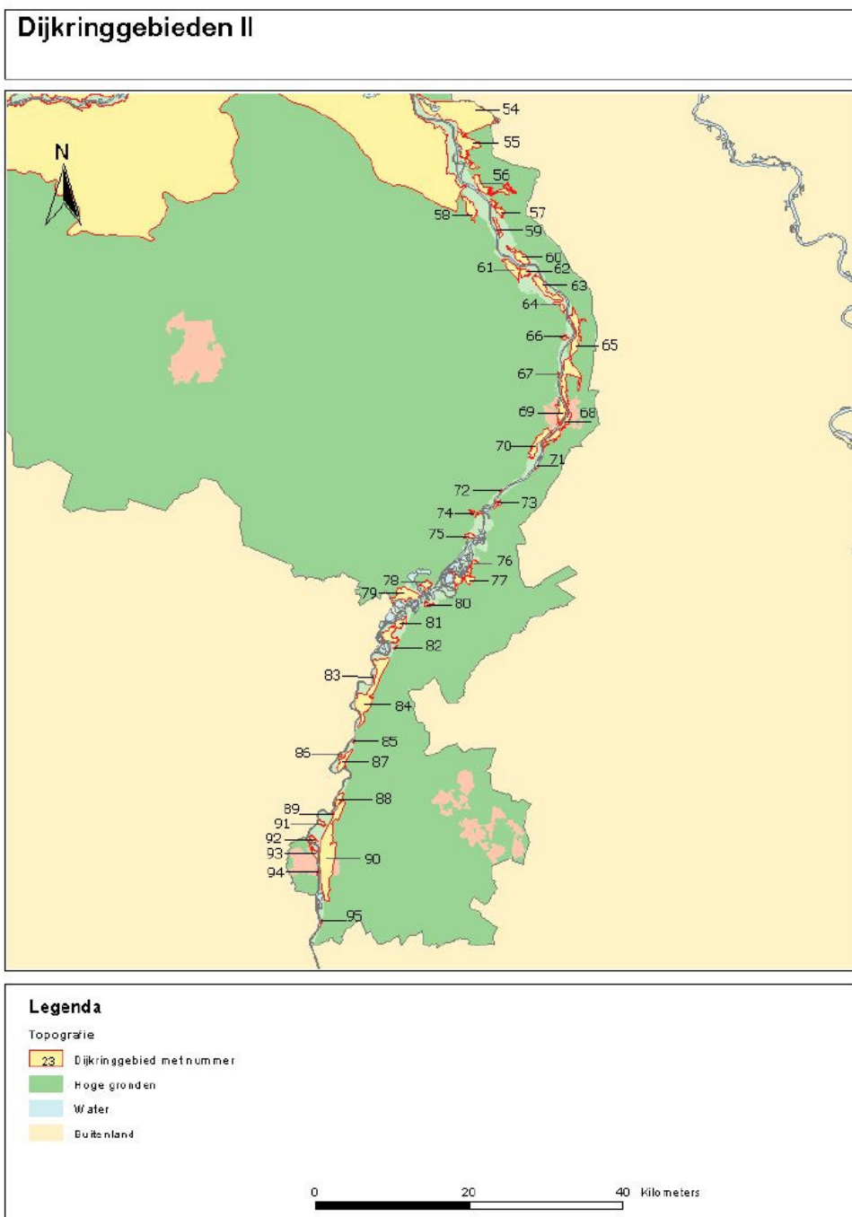
Figuur 10.2: Schematische weergave van de dijkringen 54-95. De veiligheidsnorm per dijkkring staat in bijlage IA van de Wet op de waterkering.