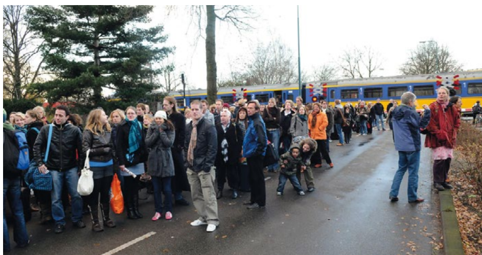
2 Evacuatie is een multidisciplinair proces geworden

via de site van het IFV ( klik hier ). Het Referentiekader biedt veiligheidsregio's een kader voor hun regionaal crisisplan. Het hanteren van uniformere functiebenamingen maakt dat bij alarmering of in de producten van bekwaamheid bevolkingszorg een ieder weet om welke functies het gaat.