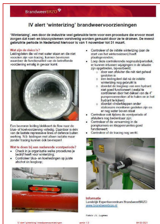
Figuur 2; IV alert 'winterizing'

In 2021 zijn zeven BrandweerBRZO-nieuwsbrieven verschenen en via e-mail gedeeld met de abonnees en online geplaatst. De nieuwsbrieven bevatten: