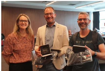
Figuur 6; LASTFIRE foam summit Parijs

Aanvullend op deze interactieve webinars zijn kennispublicaties van de behandelde onderwerpen gedeeld met de deelnemers en online geplaatst. Uit polls bleek dat deelnemers (zeer) tevreden waren over de aangeboden stof.