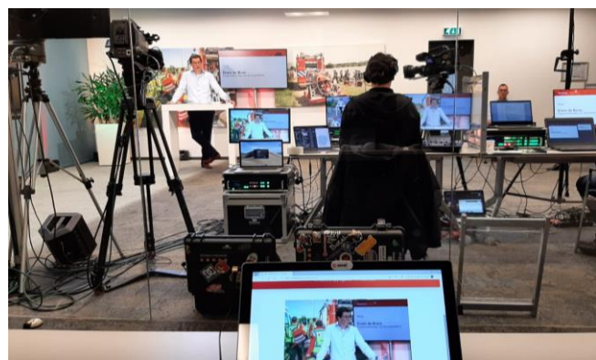
Figuur 4; de netwerkdag van 11 maart vanuit de IFV-studio