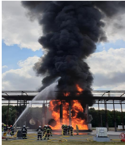
Figuur 7; demonstratie bij GESIP, Vernon

onderzoeksresultaten van praktijkproeven en nieuwe technieken. Tijdens het congres is een bezoek gebracht aan trainingscentrum GESIP in Vernon. Daar werden o.a. demonstraties gegeven van het gebruik van fluorvrij blusschuim op plasbranden (fig. 7). De opgehaalde kennis is gedeeld via onze nieuwsbrief, de website en op de netwerkdag van november. De deelnemers aan het congres vanuit het LEC wonnen de LASTFIRE foam summit quiz.