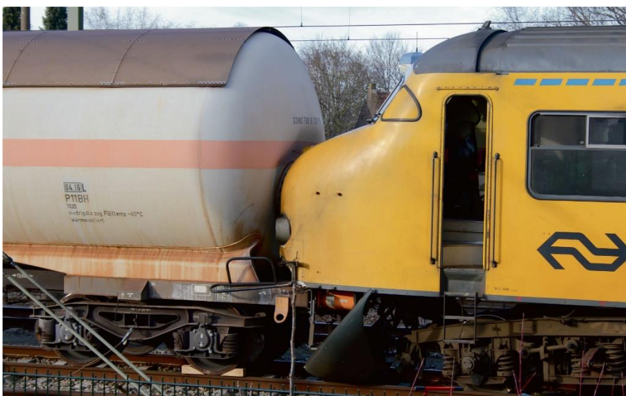
Botsing passagierstrein en wagon met gevaarlijke stoffen Tilburg (maart 2015)