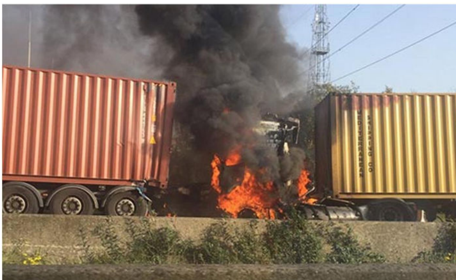
Brand LNG truck op de E313 België (oktober 2017)