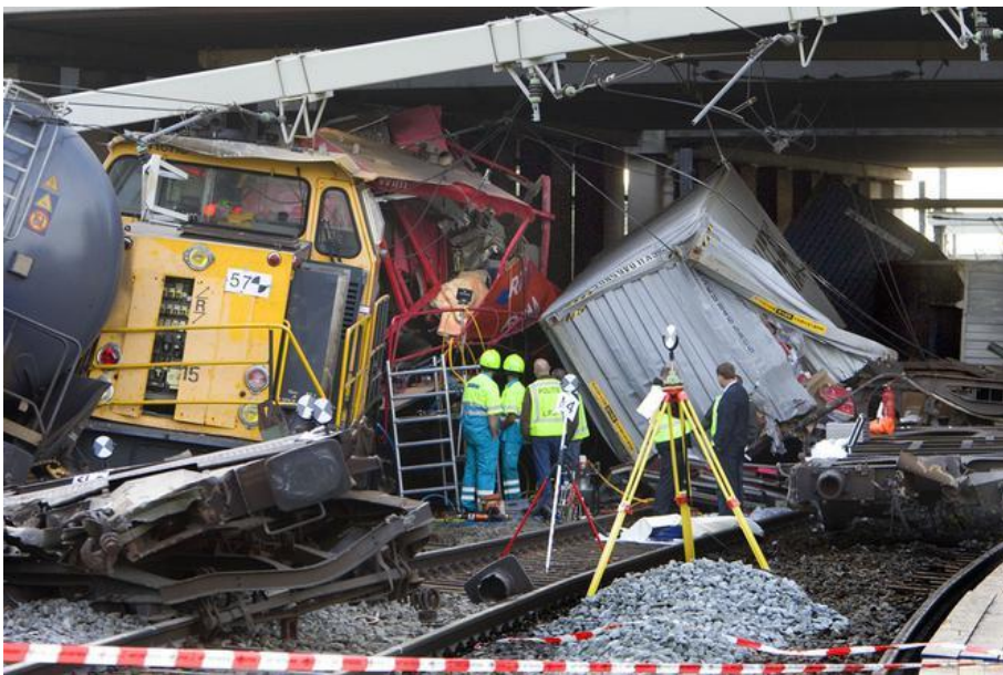
Treinramp Barendrecht (september 2009)