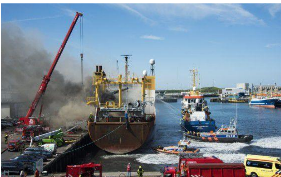
Brand visser trawler Scheveningen (juni 2014)