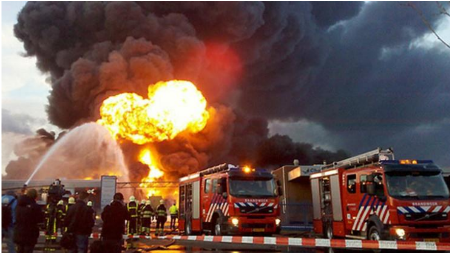
Brand Chemie-Pack Moerdijk (januari 2011)