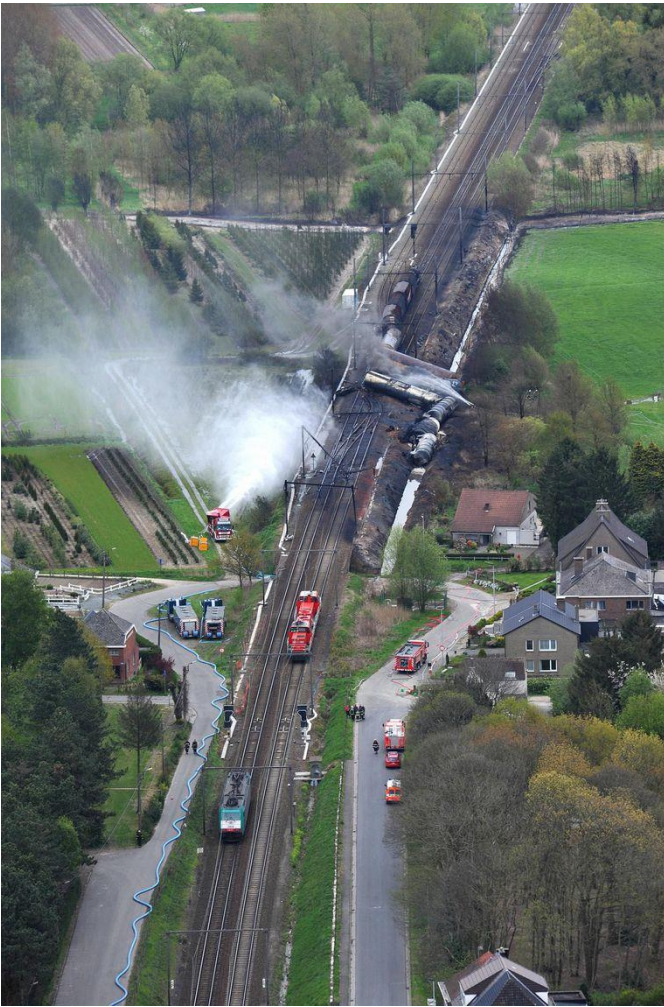
Treinramp gevaarlijke stoffen Wetteren - België (mei 2013)