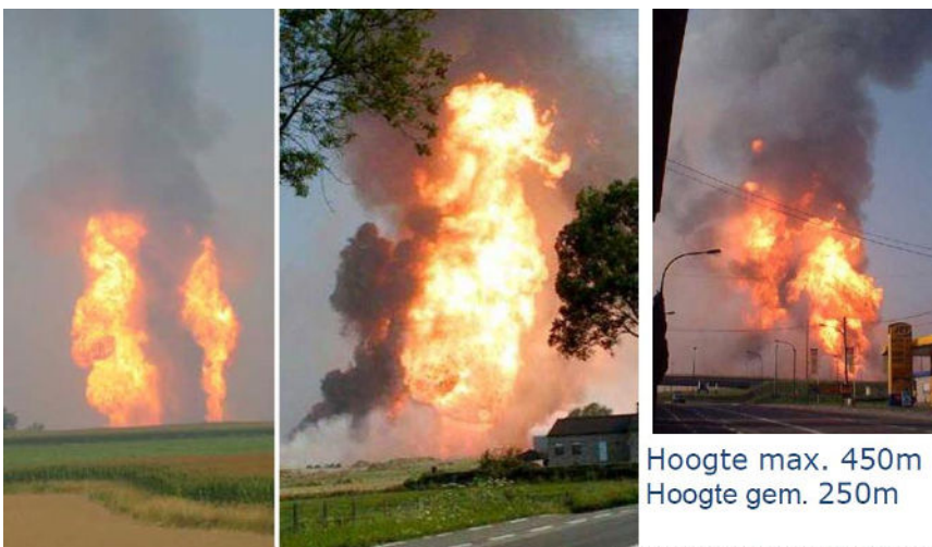
Explosie hoge druk gasleiding Gellingen - België (juli 2004)