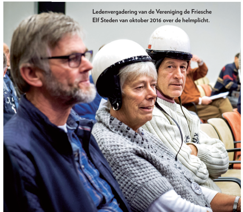
Ledenvergadering van de Vereniging de Friesche Elf Steden van oktober 2016 over de helmplicht.