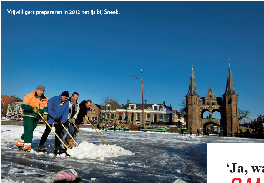
Vrijwilligers prepareren in 2012 het ijs bij Sneek.

Mijn zoon, bijvoorbeeld, zou zich niet druk maken over waar hij die nacht na de tocht zou slapen, en of hij nog thuiskomt. Die gaat daarheen en zoekt het wel uit. Desnoods zonder slaap. Zoals hij zullen er niet enkelen zijn, maar duizenden.'