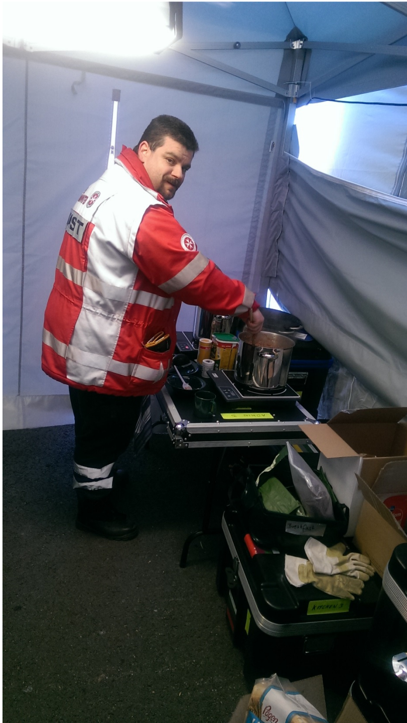
TAST aan het koken