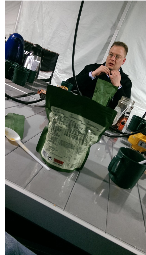
Ontbijt Lunch en Diner dag 1 / dag 2