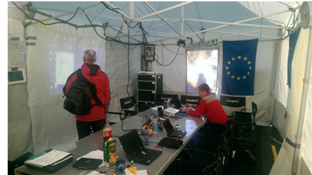
SKYPEN met ERCC