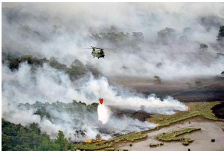
Kalmthoutse heide (2011)

In december 2015 heeft de commissaris het eindrapport van de Taskforce Natuurbranden in ontvangst genomen en de Taskforce opgeheven nadat hij deze in 2011 had ingesteld voor de provincie Noord-Brabant. Dit deed hij samen met de voorzitters van de drie Brabantse veiligheidsregio's als reactie op de grote branden op de Strabrechtse heide (2010) en op de Kalmthoutse heide (2011) en naar aanleiding van de daarmee samenhangende inspectierapporten over natuurbranden. In deze rapporten concludeerde de Inspectie Veiligheid en Justitie dat Nederland niet goed is voorbereid op onbeheersbare natuurbranden en dat gemeenten, hulpdiensten, natuurbeheerders en ondernemers beter moeten samenwerken om onbeheersbare natuurbranden te voorkomen en om de schade beperkt te houden bij toch optredende natuurbranden.