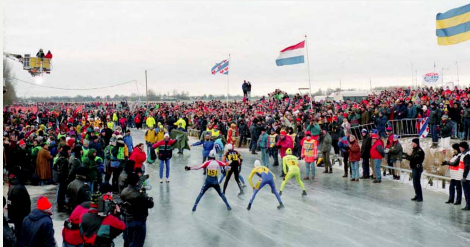
Elfstedentocht: De 'Tocht der tochten' in 1997. De draaiboeken voor komende winter liggen al klaar.

geactualiseerd", vervolgt Kleinhuis. "Samen met alle gemeenten, maar ook met vitale samenwerkingspartners, zoals de Gasunie, waterschappen en de drinkwatersector. Het is voor het eerst dat we samen met alle betrokken partners op deze manier het risicobeeld up to date hebben gemaakt."