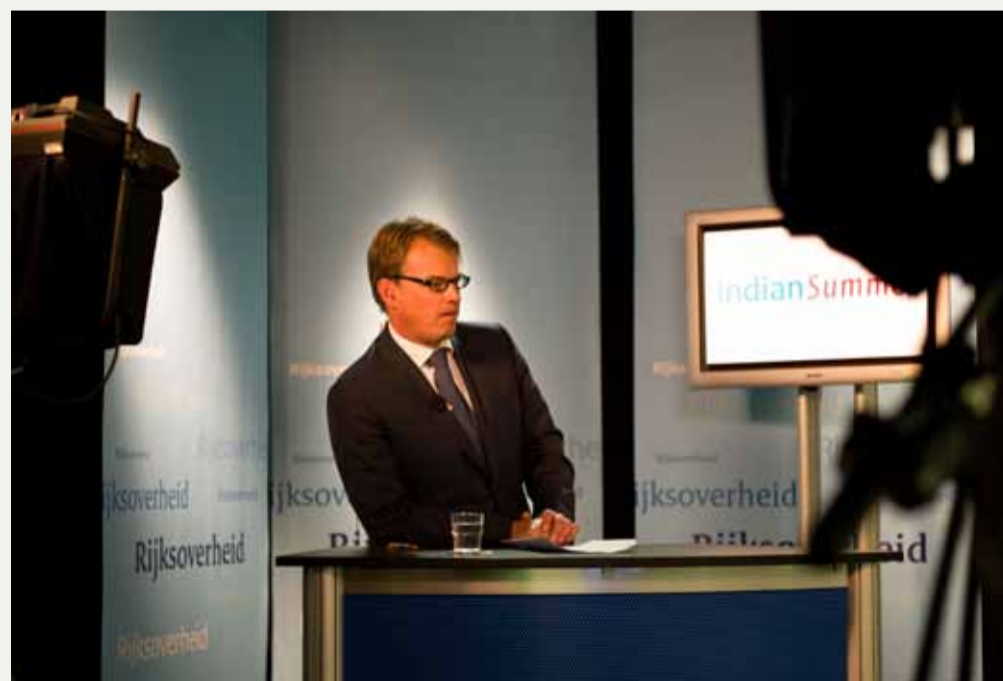
Presentator Indian Summerjournaal.

andere organisaties en partijen betrokken bij de Nationale Staf oefening Nuclear.