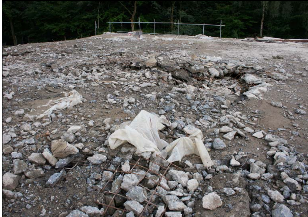
Het dak van de bunker tijdens het bezoek op 8 augustus

At the visit on the site five coiled wires of detonators were picked up randomly at different places. Two of the five wire coils had damaged insulation. The bare copper wire was free. Such damages of insulation lead to electric problems, known as short circuit to earth. Parts of the current are lost and misfires happen due to an amperage drop. Wetness favours this effect.