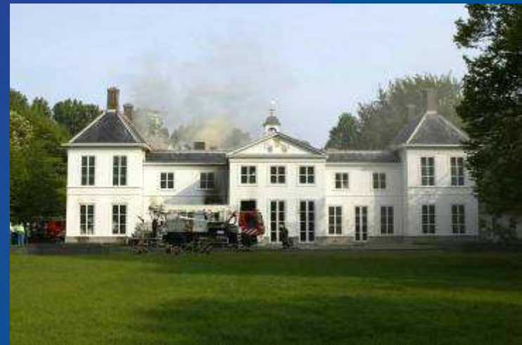
Brand Catshuis, 15 mei 2004