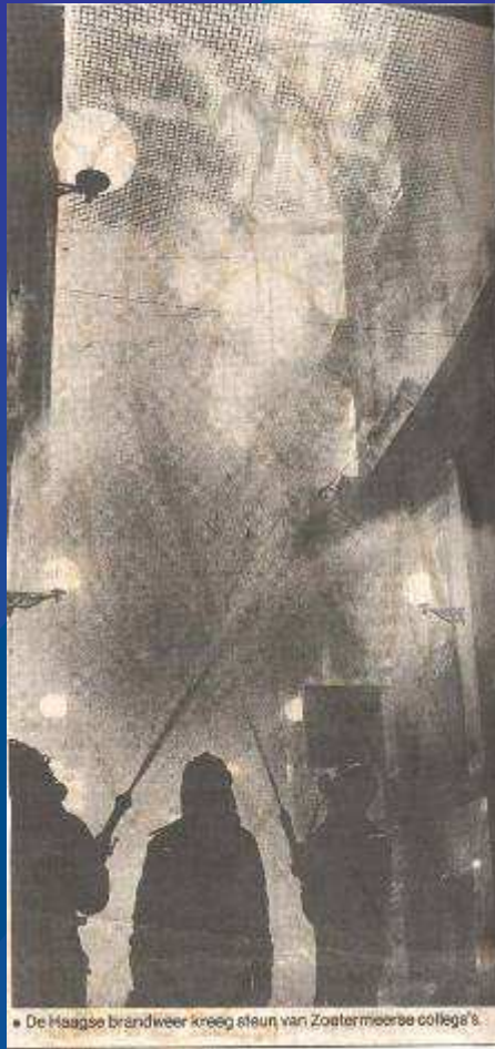
Passage Den Haag, 17 april 1990