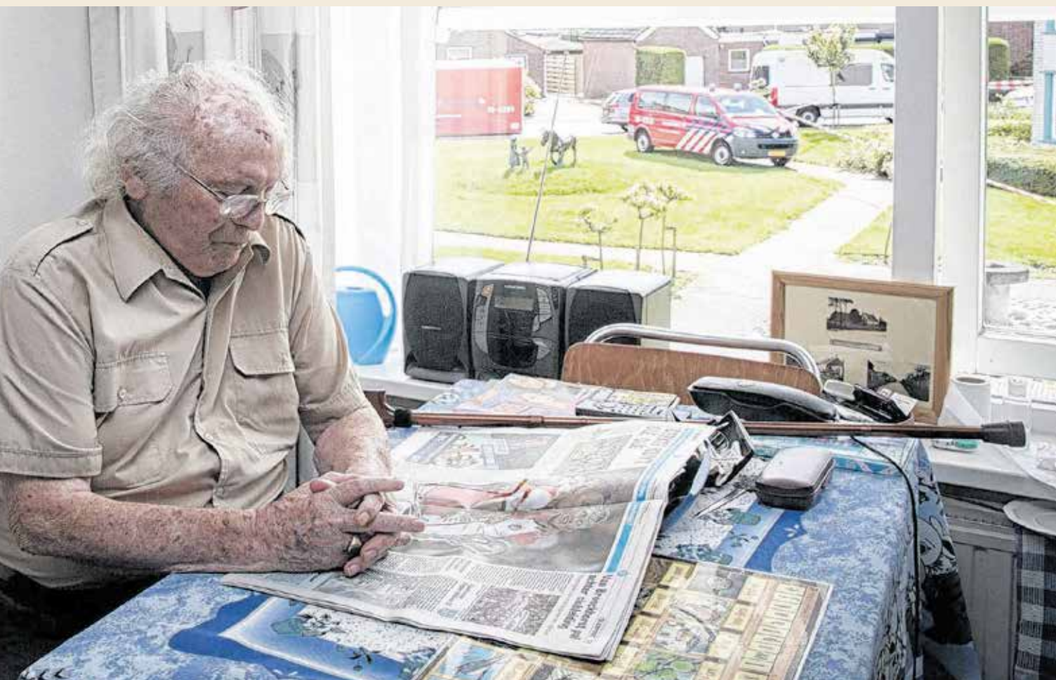
inders heeft vanuit zijn kamer zicht op het onderzoek door politie en brandweer.

geven. Twaalf door familie twintig men- andere vesti- veel gebracht. eerst de men- e verblijven te- aar Nieulande. n medicijnen ers die op an- er Weel zijn lijk binnen unnen ko- bestuurder eef een psy- astor klaar soneel van het s op te vangen. ot. Je verleent en. En dan uur later dat ie- rand is overle-