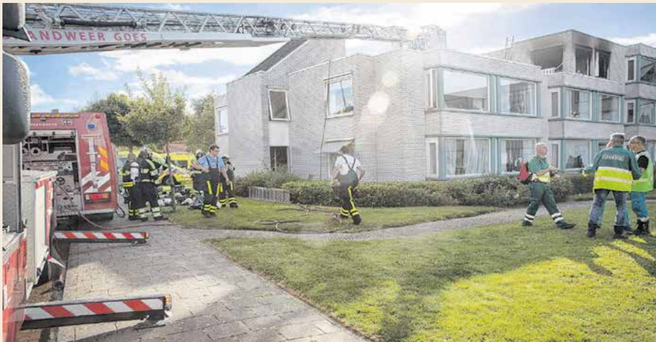
▲ De brand in verzorgingshuis Nieulande in Krabbendijkse ruim een week geleden eiste het leven van drie bewoners.