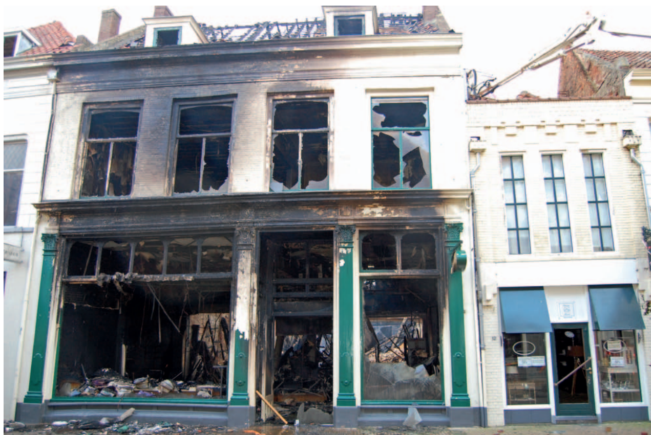
De voorgevel van het pand aan de Hofstraat in Kampen staat na de brand nog overeind.