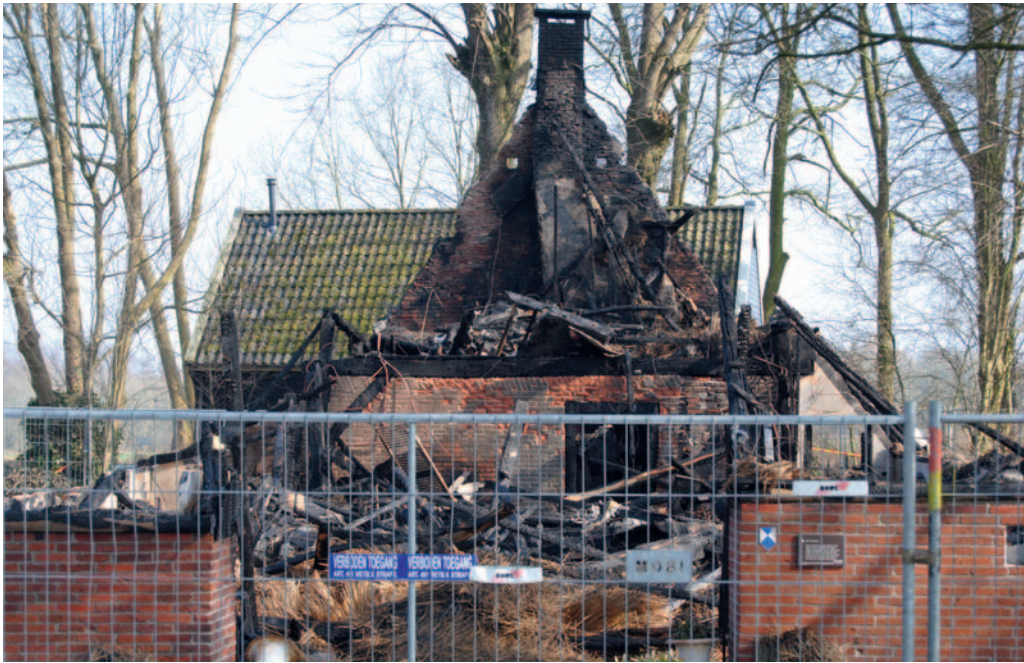
Boerderij in Gieten na de brand in maart 2012. Het monument is uitgeschreven uit het monumentenregister.

monumentale waarden. Het is belangrijk dat brandweer en erfgoed inzicht hebben in elkaars werkzaamheden en belangen. Als er na een brand sprake is van slopen of stutten, kan goed contact met de brandweer ertoe bijdragen dat muren en gebinten gespaard worden als ze geen gevaar opleveren voor de openbare veiligheid. Verbrande gebinten kunnen in de kern nog goed zijn en bij reconstructie opnieuw gebruikt worden. In overleg met de brandweer kunnen historische elementen zoals sierstenen of gietijzeren ornamenten uit het puin gered worden voordat onverlaten ermee aan de haal gaan. Zo blijven monumentale waarden behouden.